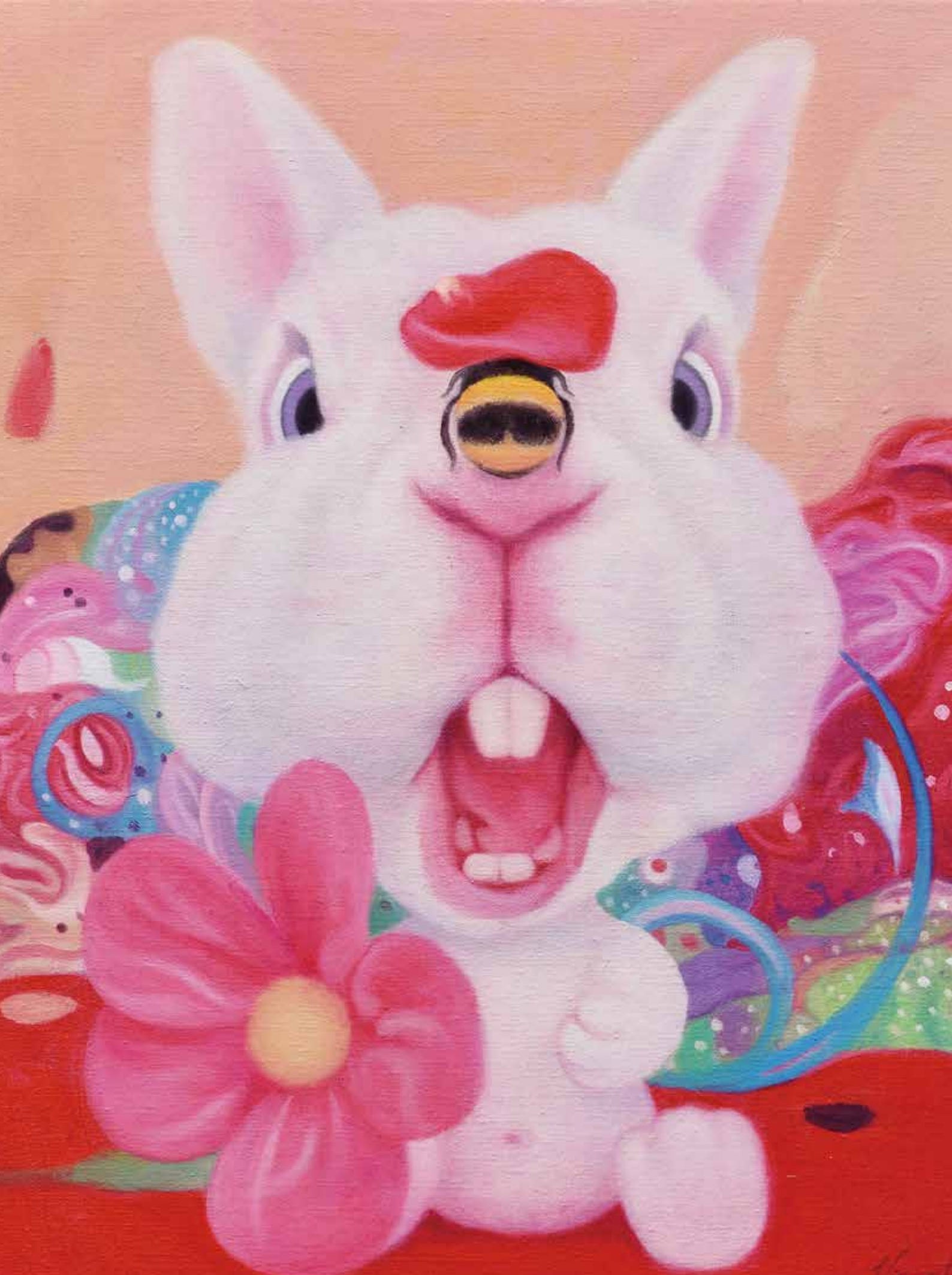
葉天生 逛花園的那一天油畫 2022 油彩畫布 53.0×45.5cm