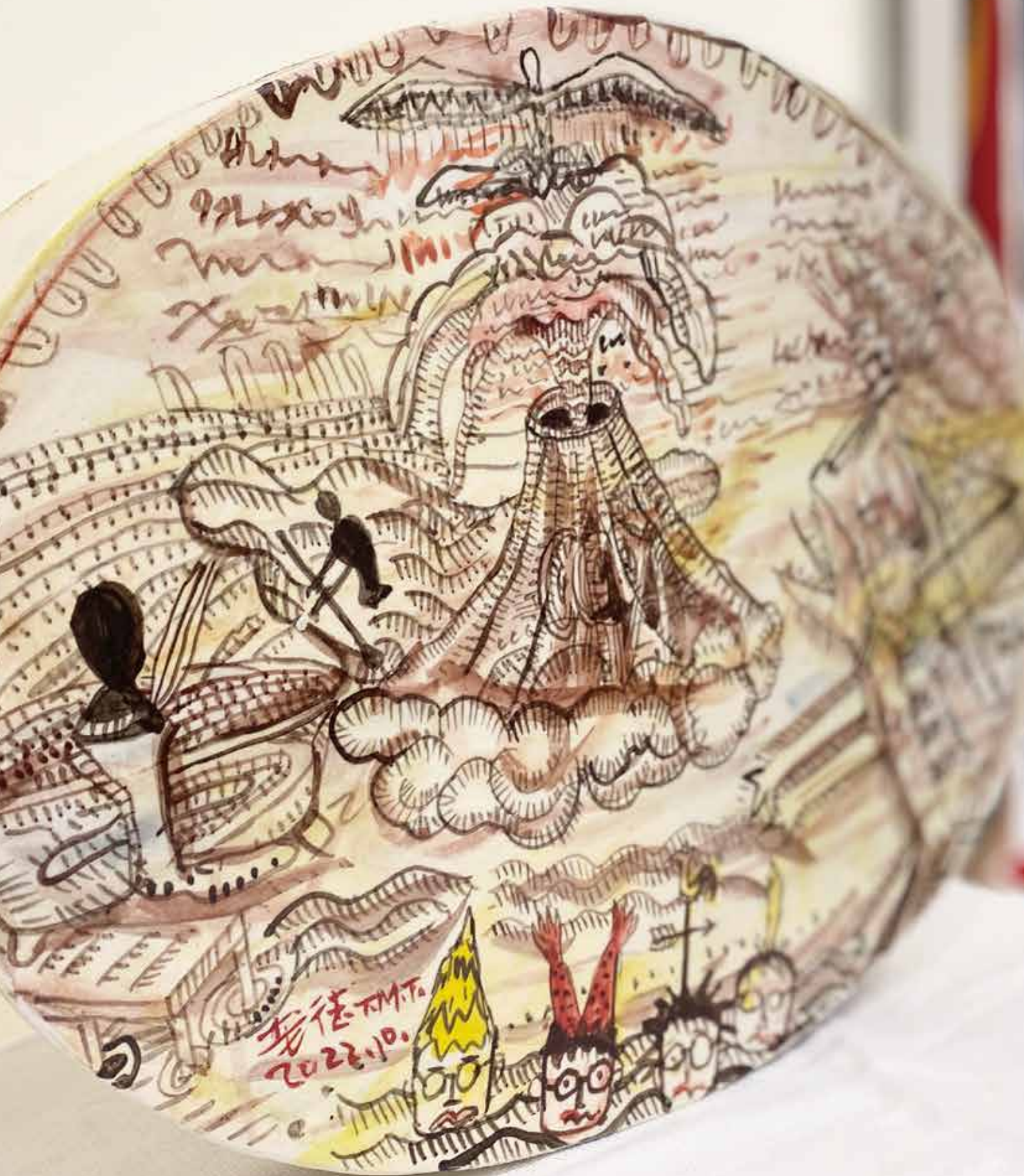
戴明德 今古時空對流 2022 陶瓷 Ceramic 34.5x48.3x6.2cm