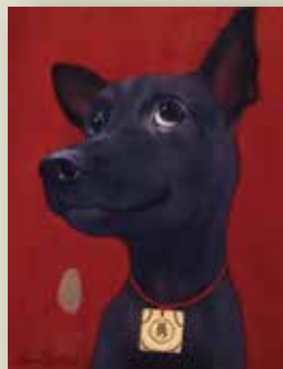
勇哥-台灣黑狗兄 2023 油彩畫布 35x27cm

宏觀黑狗兄系列，觀者可把它當成是狗來富、招財進寶的隱喻，亦可將黑狗兄系列象徵台灣愛拚才會贏的精神，期望大家只要良善、勤奮、勇敢，人人都可以富貴吉祥旺得福。