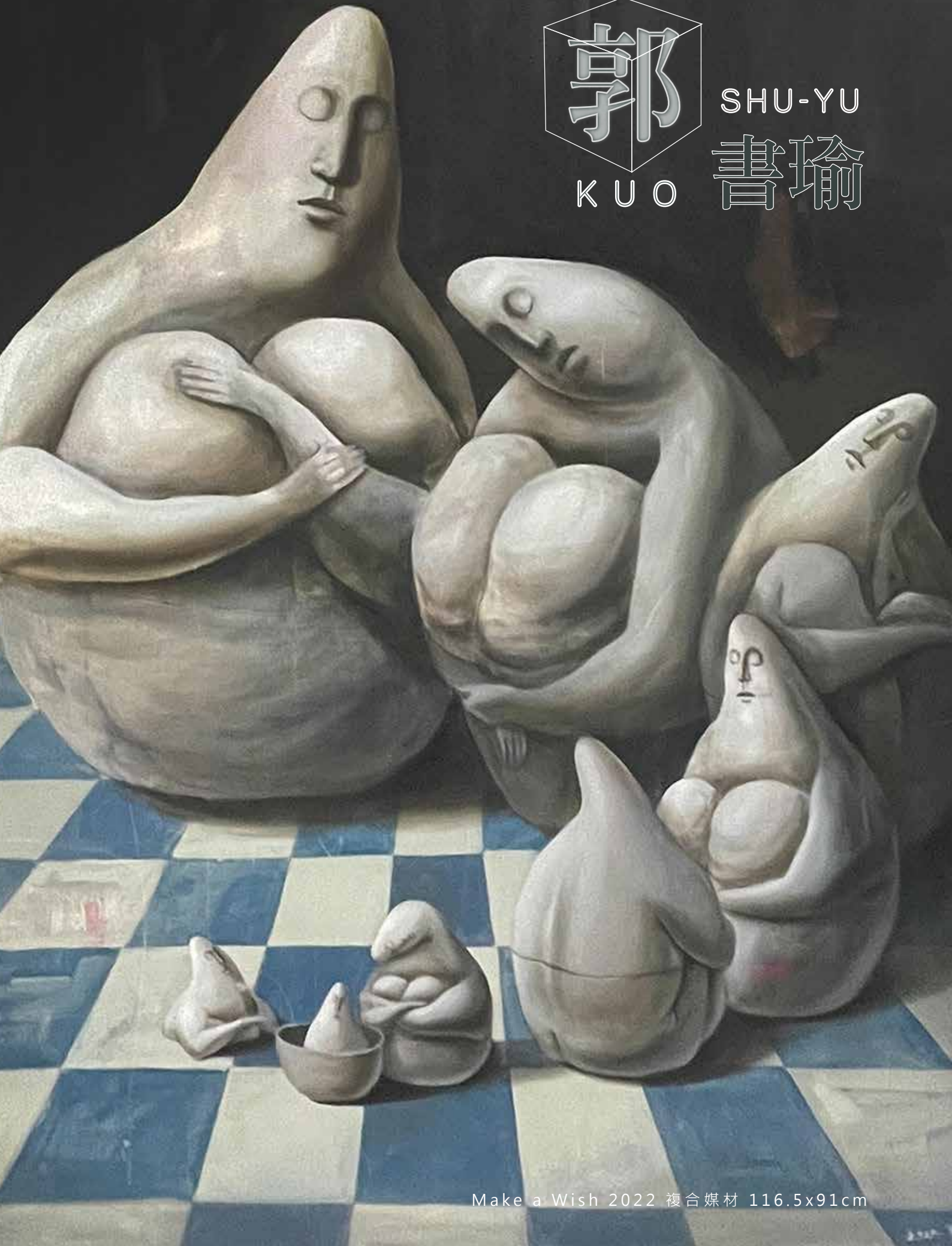
Make a Wish 2022 複合媒材 116.5x91cm