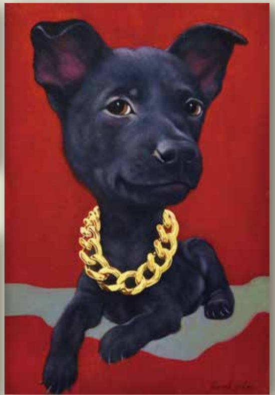
▲阿尼基 2023 油彩畫布 60.5×41.0cm