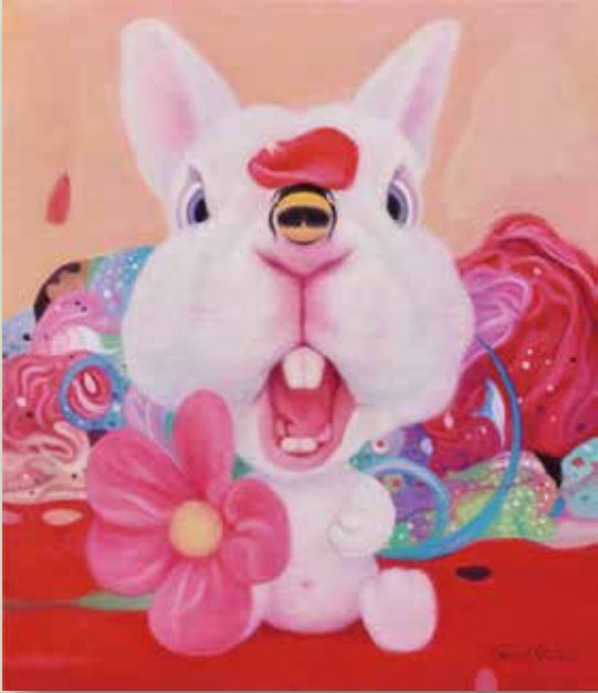
逛花園的那一天油畫 2022 油彩畫布 53.0×45.5cm