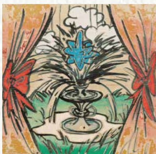
患者記—許願池 (fake) 2023 木刻原板 水彩設色 47x46cm