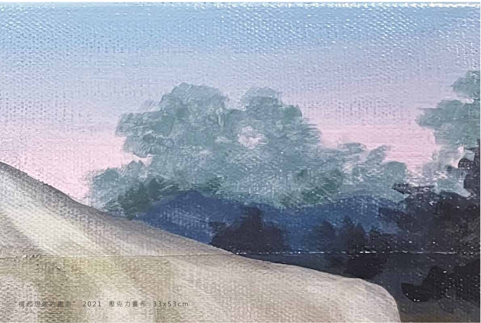
"撐起想像的畫面" 2021 壓克力畫布 33x53cm