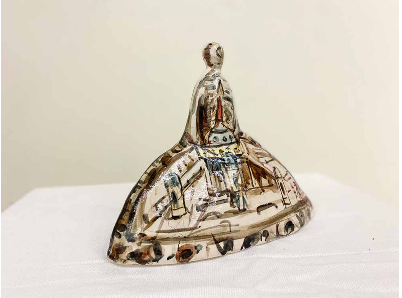
戴明德 公主系列 2022 陶瓷Ceramic 22x27x13.3cm