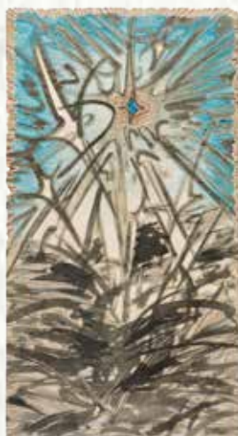
星星誕生 No.1 2023 木刻原板 水彩設色 59x31cm