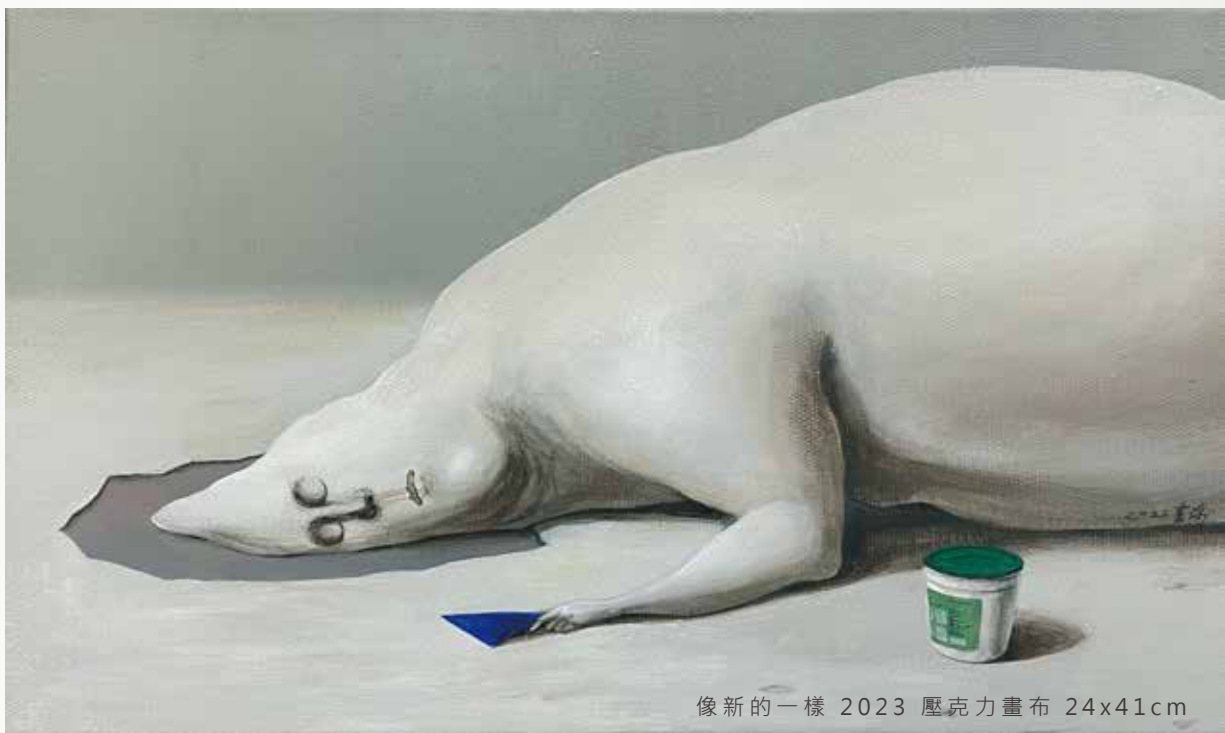
像新的一樣 2023 壓克力畫布 24x41cm

個人創作中描繪了現實之下，時而自然膨脹、時而被重塑的人們，在感性放縱與理智框架之間拉扯，來回於抵抗與接受之間，自然地接受這份無能為力，最終趨向一個固定的狀態。