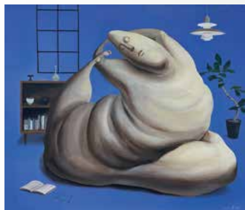
理想生活剪貼 2023 壓克力畫布 45.5x53cm

The creative process for Kuo Shu-Yu is a method of conscious selection of everyday activities. Through the process of free writing and repetitive tasks, she learns to cope with anxiety and adjust to reality. On the basis of visual art, Shu-Yu studies objects that can best express the phenomena in her mind. By observing and re-imagining objects, she attempted to utilize its inherent meaning and charms in her art.