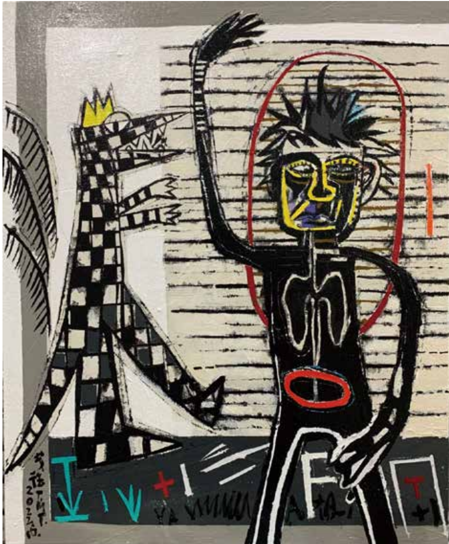
戴明德 Ming-Te TAI

從欲罷不能的信手塗鴉中，發展出技法獨到的複合媒材繪畫體系， 藉此回望藝術史並不斷觀照自我的心路歷程。