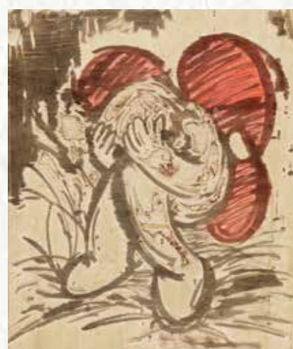
媽媽，我真的畫不出來了 2023 木刻原板 水彩設色 42x50cm