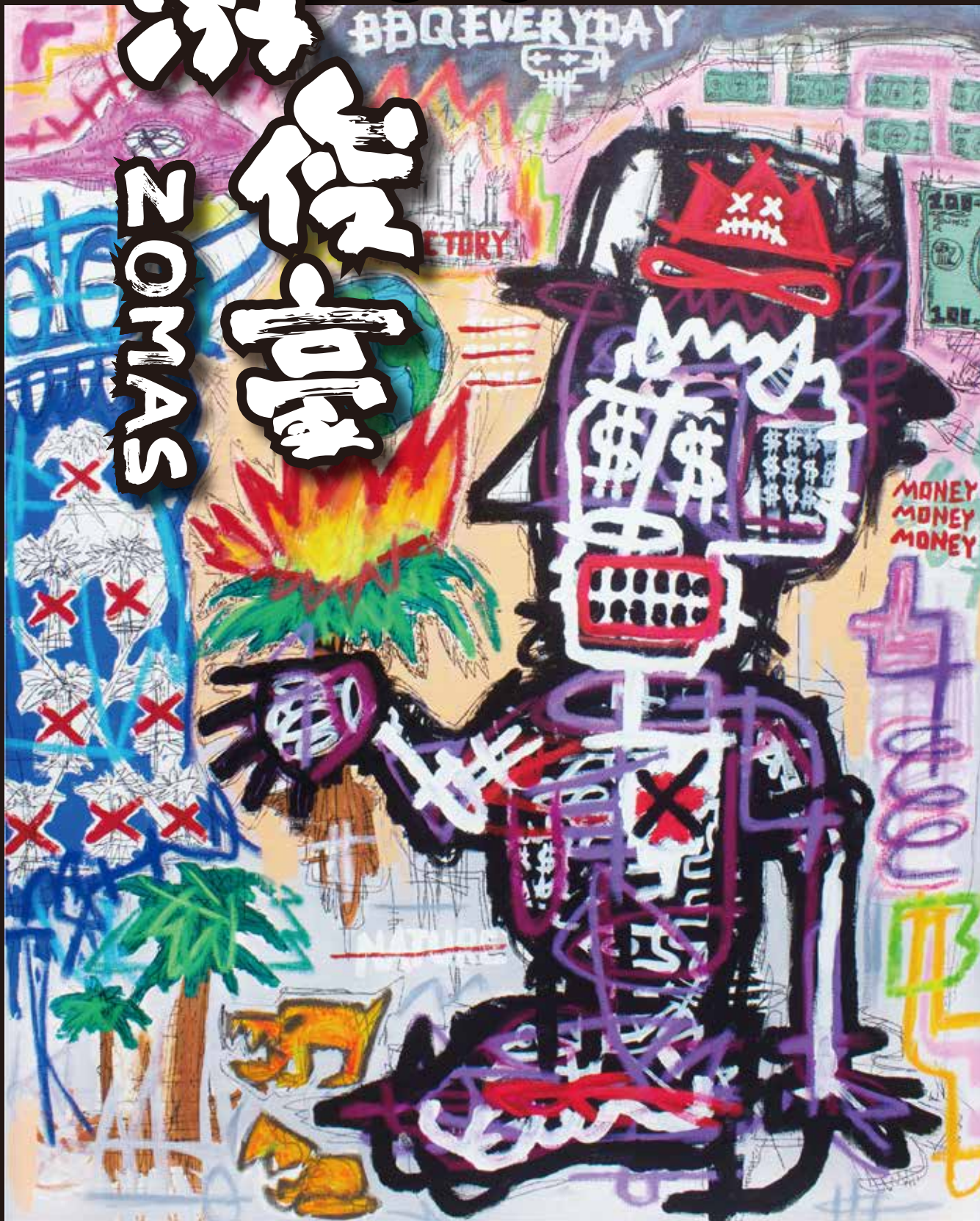
BBQ EVERYDAY 2023 Mixed Media on Canvas 100 x 80 cm