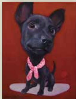
寶哥-台灣黑狗兄 2023 油彩畫布 41x31.5cm