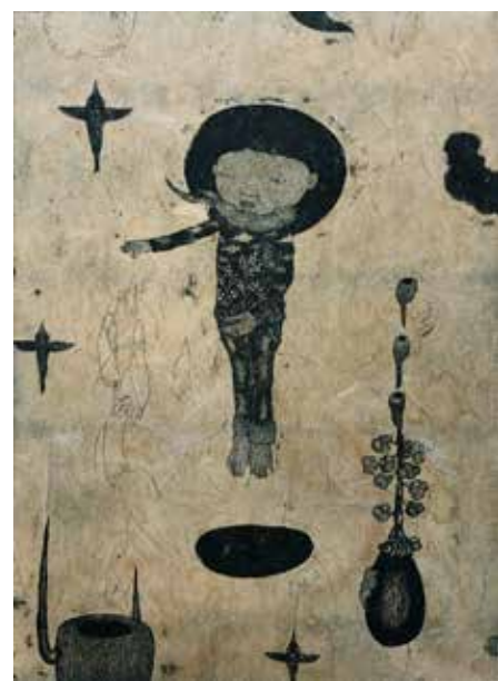
You Are Looking At Me 3