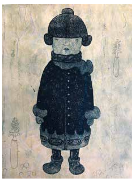
A Boy is Looking That